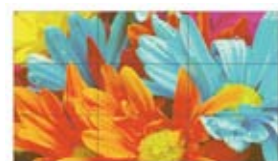
●ホワイトバランス機能 OFF