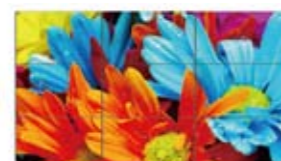
●ホワイトバランス機能 ON