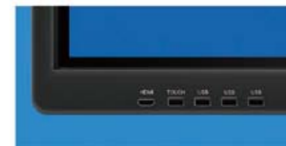
*液晶画面左下のインターフェース

■ 液晶前面右下に電源、メニューキー、音量などのファンクションキーを搭載することにより、電子黒板をより便利にお使いいただけるようになりました。液晶前面左下に搭載された多彩なインターフェースは、お使いモバイル機器、メモリーカードなどから簡単に情報を取り入れることも可能です。