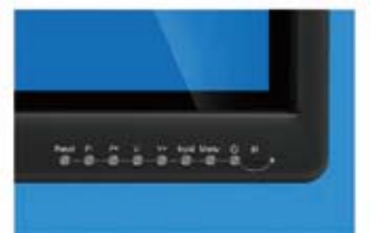
*液晶画面右下のファンクションキー