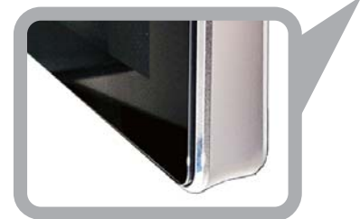
■ エッジに美しい光沢面を加工